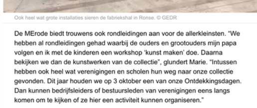
Ook heel wat grote installaties sieren de fabriekshal in Ronse.